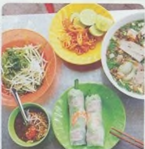
VIETNAMSKÁ KUCHYNĚ STR. 448