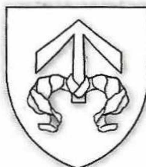
Osovští z Doubravice