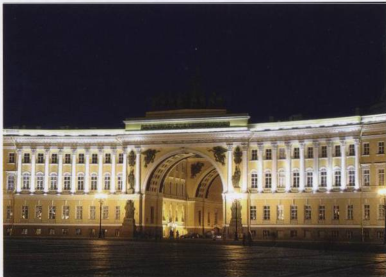
Palácové náměstí v Petrohradě