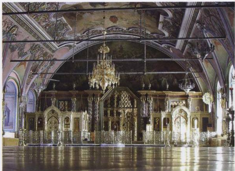
Refektář v Sergijev Posad