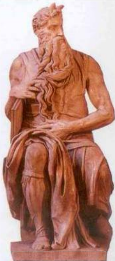
Michelangelův Mojžiš v San Pietru in Vincoli