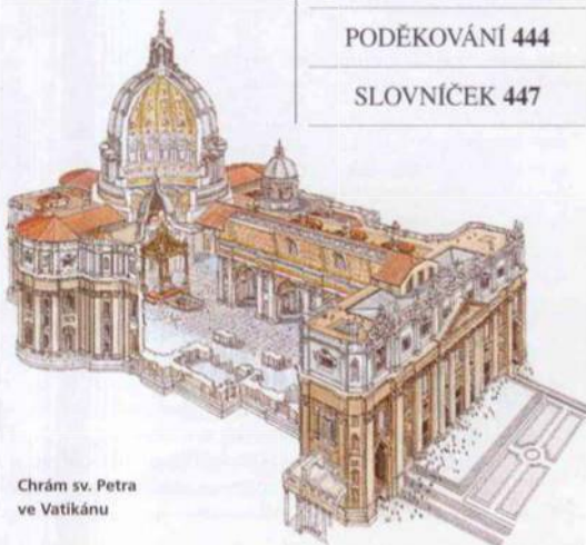
Chrám sv. Petra ve Vatikánu