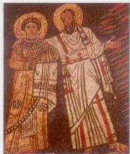
Mozaika v Santa Prassede