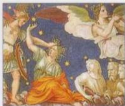
Fresky ve Ville Farnesina