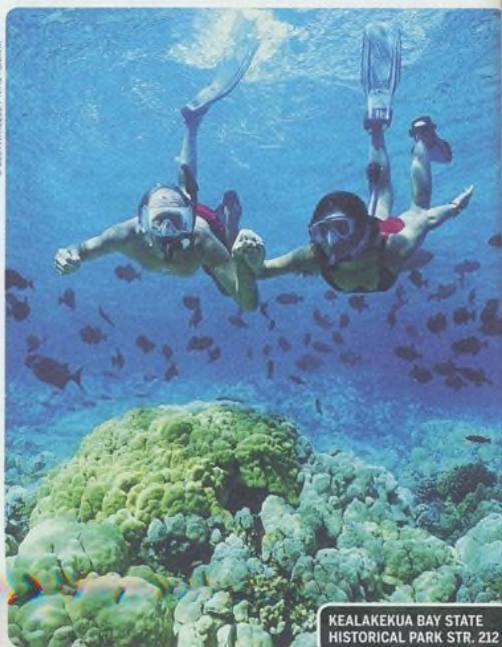
KEALAKEKUA BAY STATE HISTORICAL PARK STR. 212