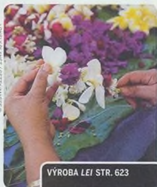
VÝROBA LEI STR. 623