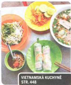
VIETNAMSKÁ KUCHYŇÉ STR. 448