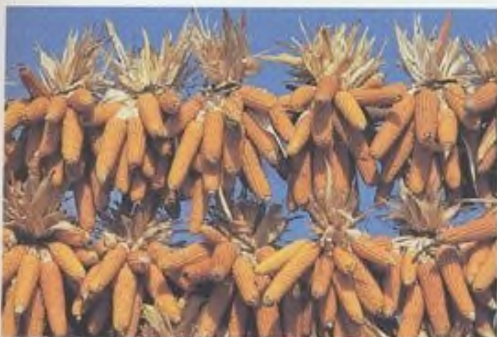
Kukuřice je jako krmiva pro dobytek škoda