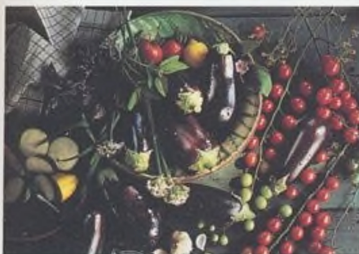
Nejlepší je konzumovat čerstvou zeleninu