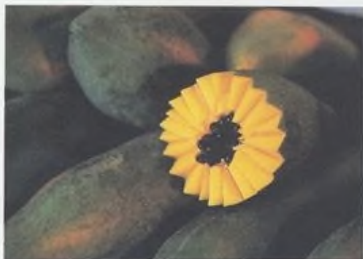
Čerstvé papáje dodávají nejlepší biolátky