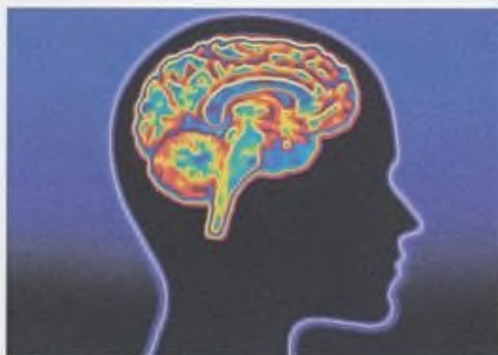
Mozek potřebuje biolátky z ovoce a zeleniny