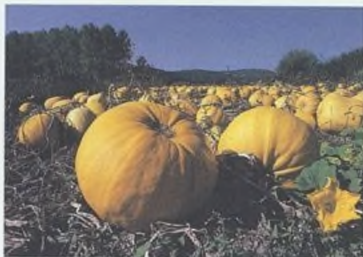
Dýně – obr zelinářského pole