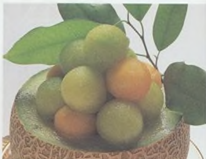
Meloun – chutný, osvěžující a léčivý