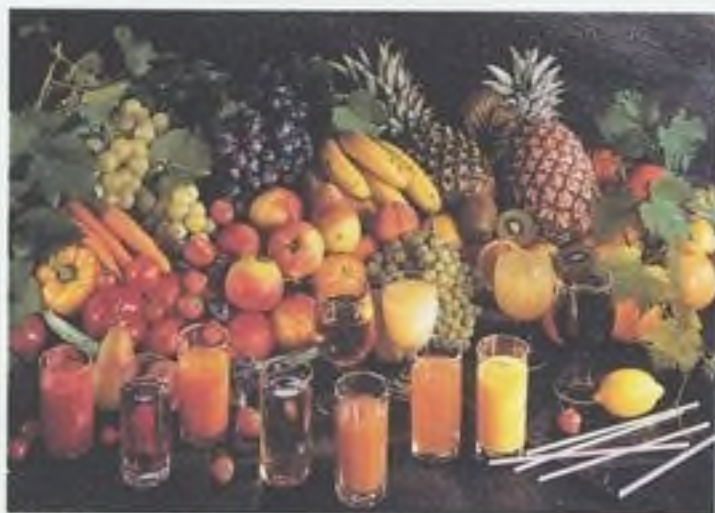
Příroda poskytne nejlepší medicínu