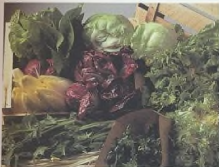
Výběr salátů je bohatý