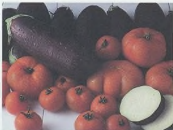
Rajčata kombinovaná s lilky – prvotřídní lahůdka