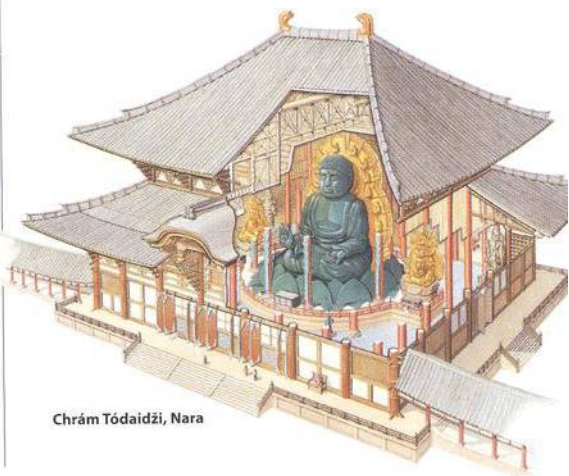
Chrást Tódaidži, Nara