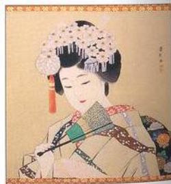
Závěs s vyobrazením gejši v muzeu v Takajamě