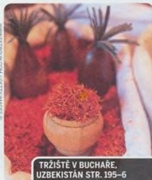
TRŽIŠTĚ V BUCHARĚ, UZBEKISTÁN STR. 195-6