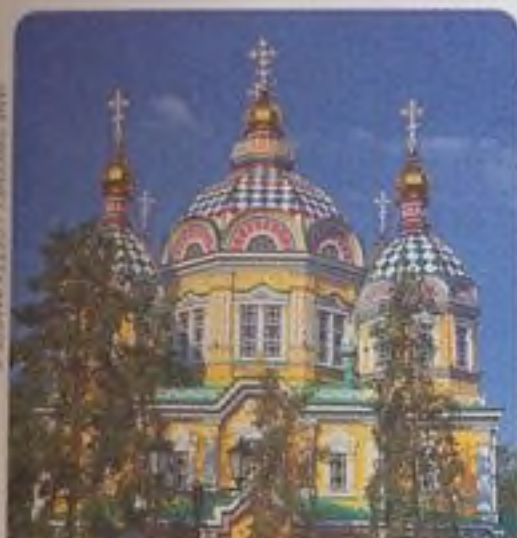
KATEDRÁLA SVATÉHO NANEBEVSTOUPENÍ, ALMATY, KAZACHSTÁN STR. 57