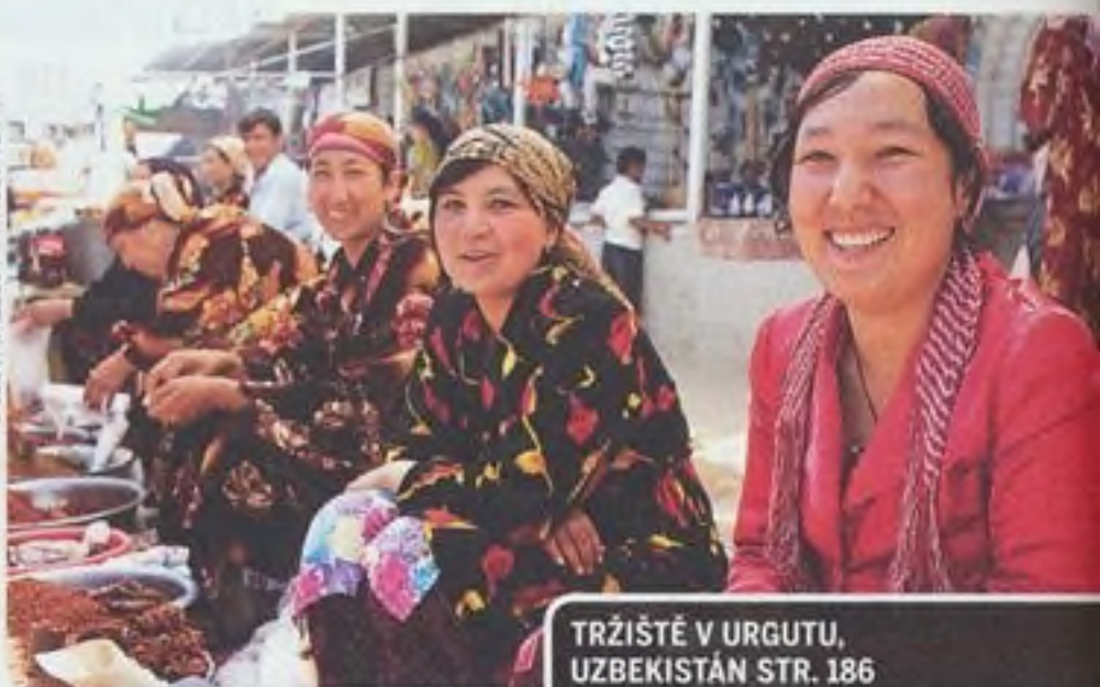
TRŽIŠTĚ V URGUTU, UZBEKISTÁN STR. 186