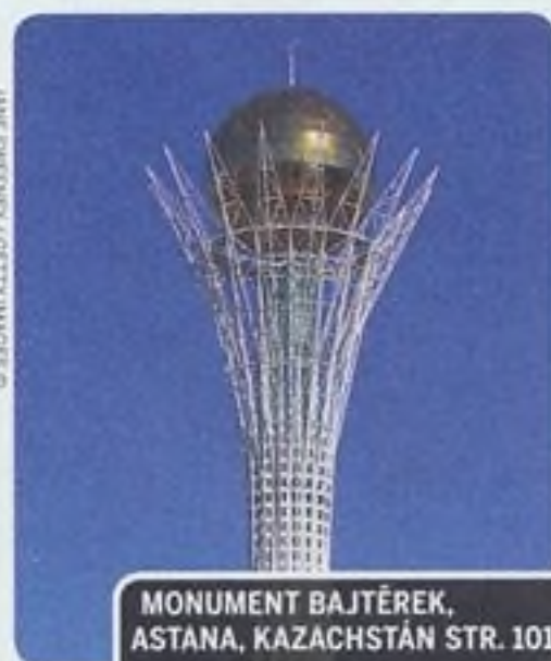
MONUMENT BAJTĚREK, ASTANA, KAZACHSTÁN STR. 101