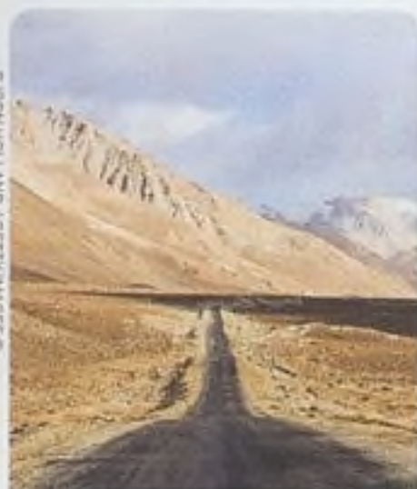
PAMÍŘSKÁ DÁLNIČE, TÁDŽIKISTÁN STR. 365