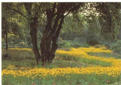
Zahrada se žlutými plochami rudbekií (třapatek)