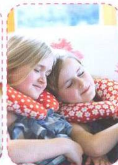
Polštář podkova, strana 50