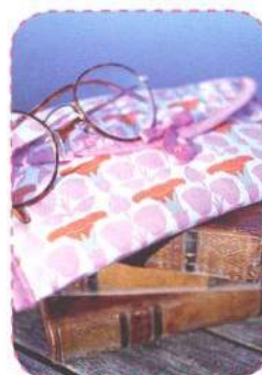
Pouzdro na brýle, strana 42