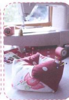
Jehelníček, strana 74