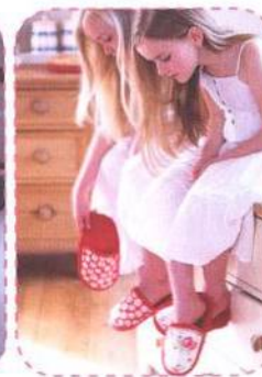
Bačkory, strana 76