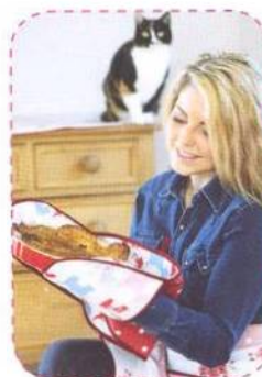
Chňapky, strana 68