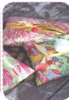
Pouzdro na vlhčené ubrousky, strana 20