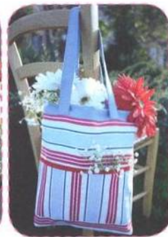
Nákupní taška, strana 22