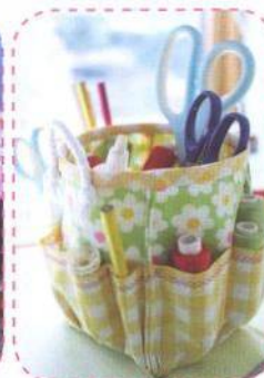
Šikovný košíček, strana 46