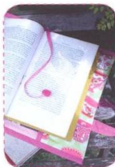
Obal na knihu, strana 16