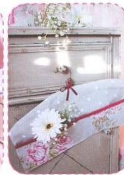
Vak na drobnosti, strana 80