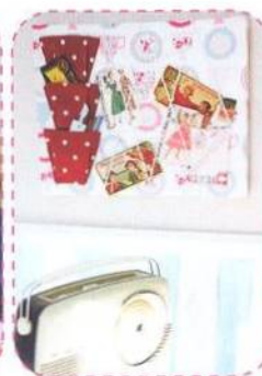
Nástěnka, strana 70