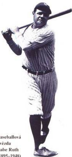
Baseballová hvězda Babe Ruth (1895–1948)