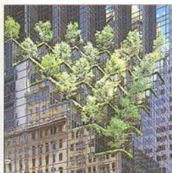
Trump Tower, Upper Midtown