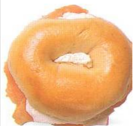
Bagel z newyorského lahůdkářství