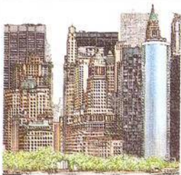
Silueta jižního Manhattanu