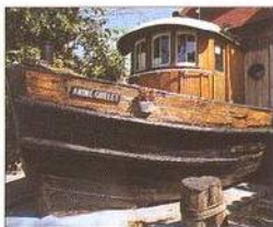
Remorkér v North Wind Undersea Institute Museum