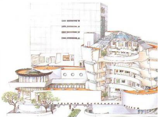
Guggenheimovo muzeum, Upper East Side