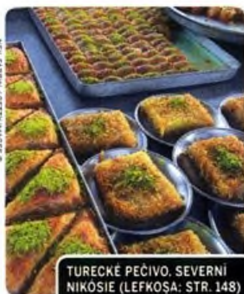
TURECKÉ PEČIVO, SEVERNÍ NIKÓSIE (LEFKOŠA; STR. 148)