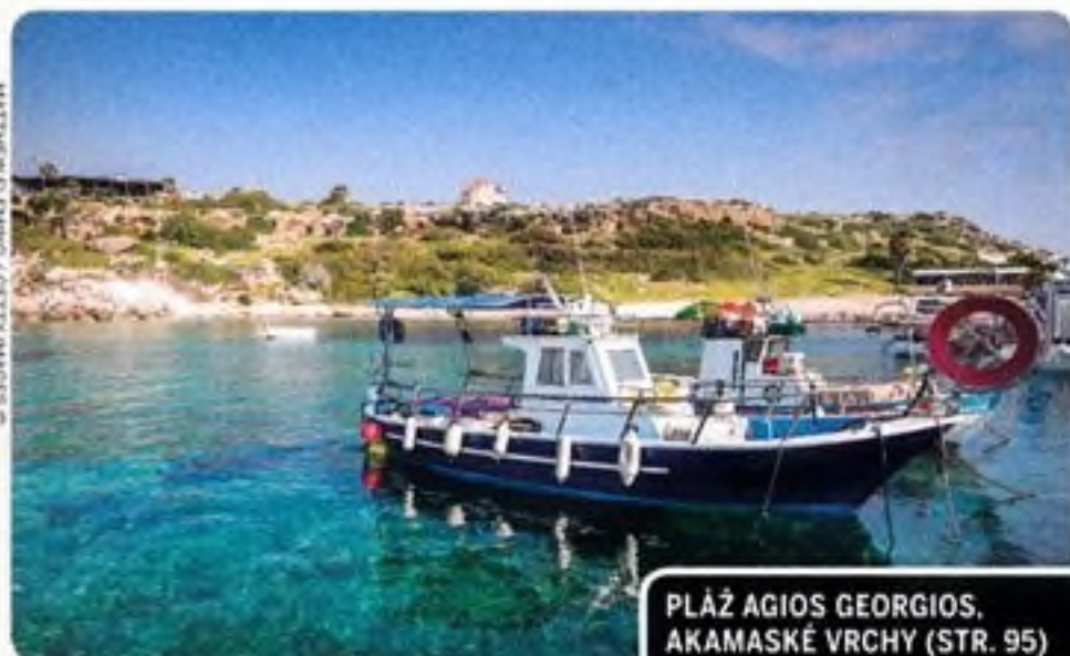
PLÁŽ AGIOS GEORGIOS, AKAMASKÉ VRCHY (STR. 95)