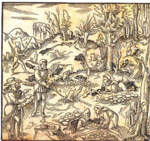
Různé metody získávání kovů podle Agricolaova spisu o hornictví a hutnictví z 16. století (str. 24)

Dva zámky v Hradci nad Moravicí jsou na první pohled nápadné svými kontrastními barvami. Jeden je renesanční, zatímco druhý novogotický