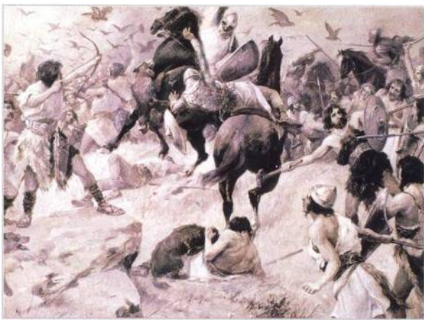
Hrdina Tyrš v knížecí zbroji pobíjí Lučany v bitvě na Turském poli (str. 46)

Spisovatel Otakar Batlička se za první republiky proslavil hlavně díky Mladému hlasateli, ale většina jeho příhod jsou jen nepodložené legendy