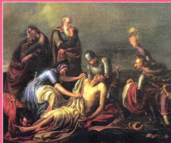
Mrtvý Ludvík Jagellonský na obraze Somy Orlaie Petricha z roku 1851 (str. 78)