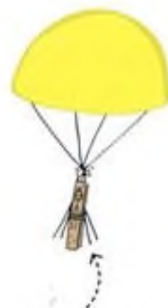
Porovnej padáky různých tvarů na straně 126