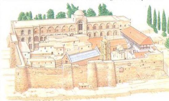
Odlehlý klášter sv. Kateřiny na Sinajském poloostrově