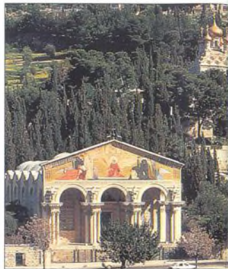
Olivová hora v Jeruzalémě