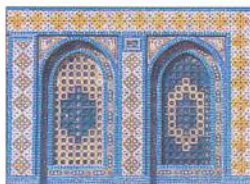
Detail okna Skalního chrámu