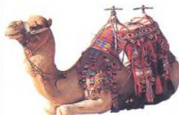
Velbloud beduína, západní Jordánsko