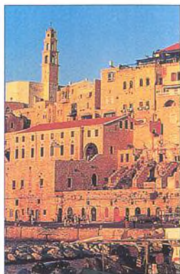
Přívábivé nábřeží ve staré Jaffě