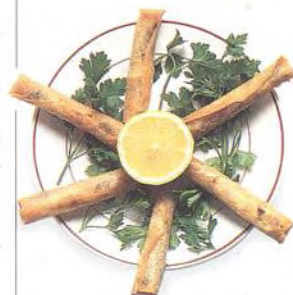
Marocká „cigára“, oblíbená pochoutka