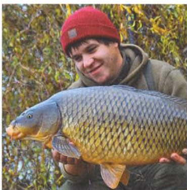
10 6 zimních tipů