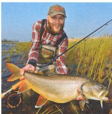
04 Velké medvědí jezero