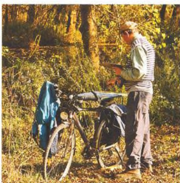
32 Příběhy psané do vody – Starý rybář