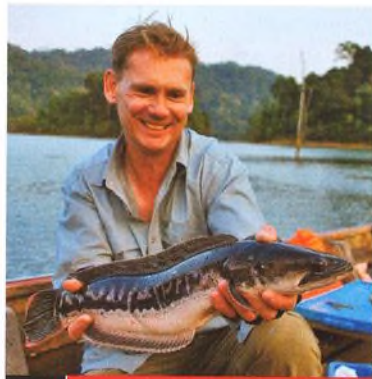
04 Thajskými pralesy po stopách hadohlavců