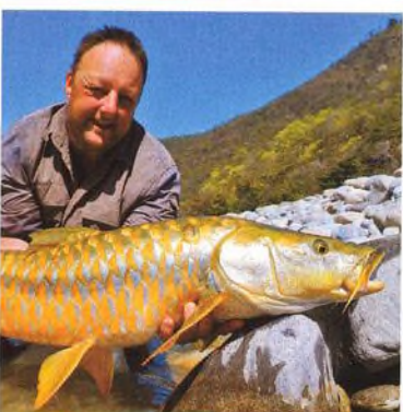
26 Indické dobrodružství