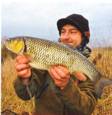
10 Rock 'n' roll – lov zimních tloušťů