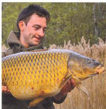
10 Lac du Amance – výlet do divočiny