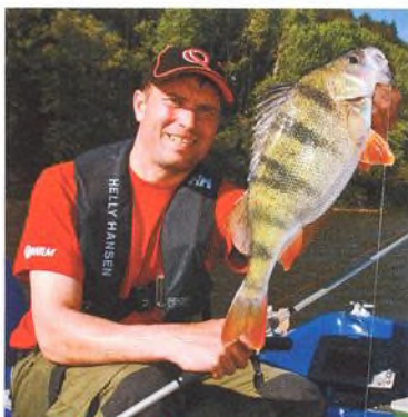
22 Drop Shot / se žízalou na háčku