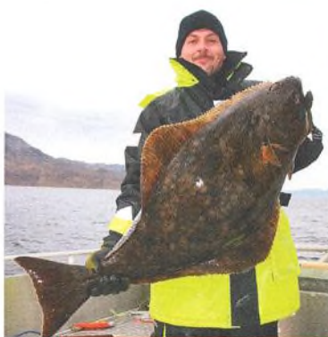
06 Storekorsnes / kouzlo lovu v průlívích