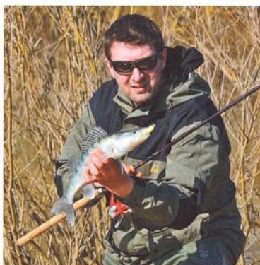
34 Candát z ledové řeky PO