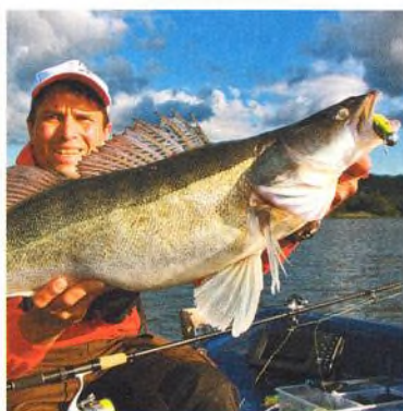
16 Candátí „desatero“