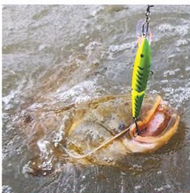
20 Italské sumcobraní