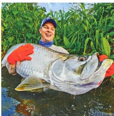
06 Tapám – tarponi z džungle