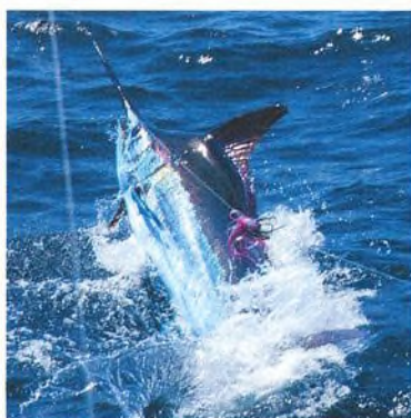
30 Česko-slovenský rekord!!!