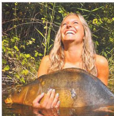
8 Mimo vyšlapané stezky...