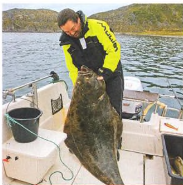
04 Kárhamn / rybaření v rauši