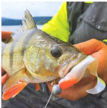
22 Návrat ke klasice