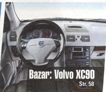
Bazar: Volvo XC90 Str. 58