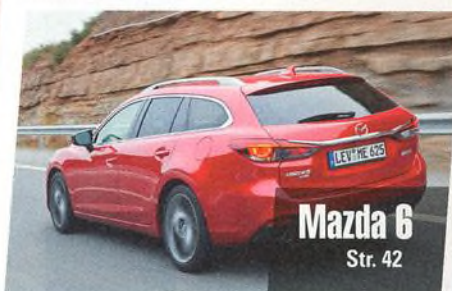
Mazda 6 Str. 42