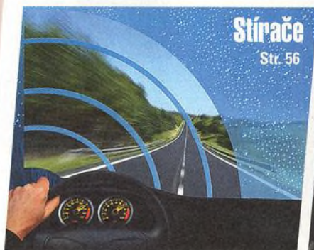
Stírače Str. 56