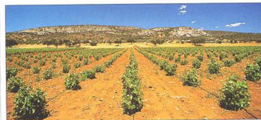
Pěstování hroznového vína v La Manche, kde se nacházejí nejrozsáhlejší vinice na světě

KAM V MADRIDU ZA NÁKUPY A ZA ZÁBAVOU 304