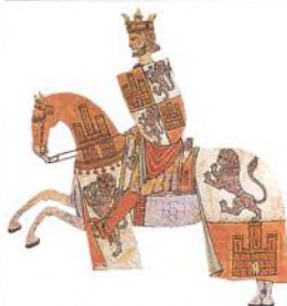
Král Alfons X. Učený