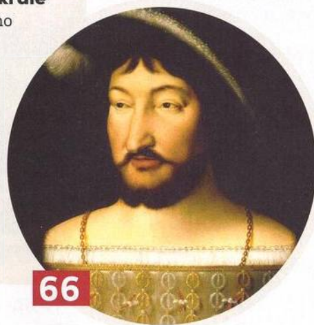
✦ František I. na portrétu od Jeana Cloueta z roku 1539