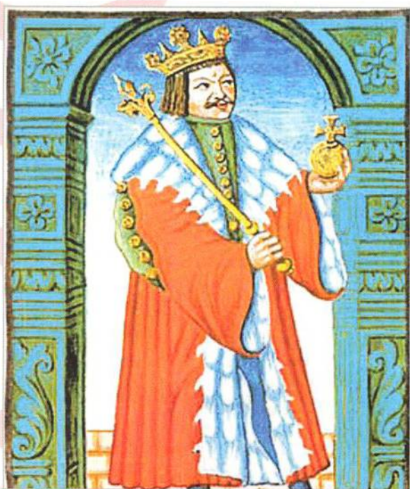
↑ Jiří z Poděbrad