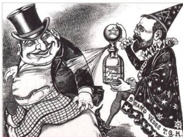
T. G. Masaryk terčem antisemitské karikatury v době hilsneriády

Byla tajemná, krásná, inteligentní a okouzila následníka rakouského trůnu