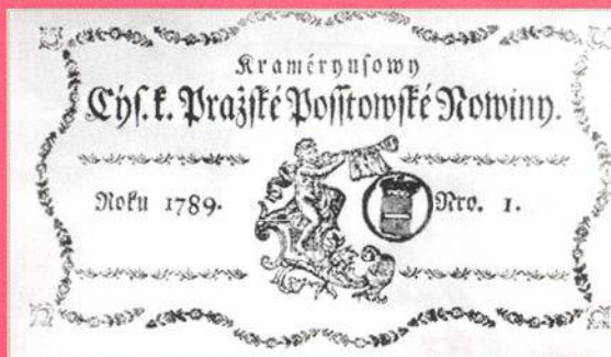
Hlavička Krameriových novin