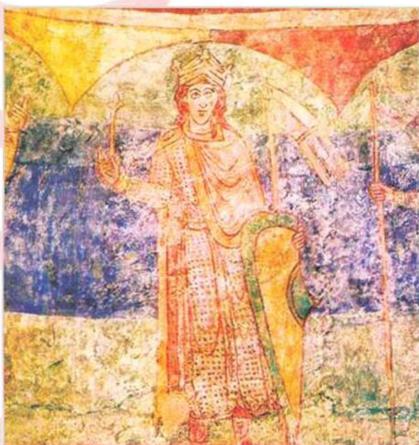
Vratislav II. získal jako první Přemyslovec královskou hodnost