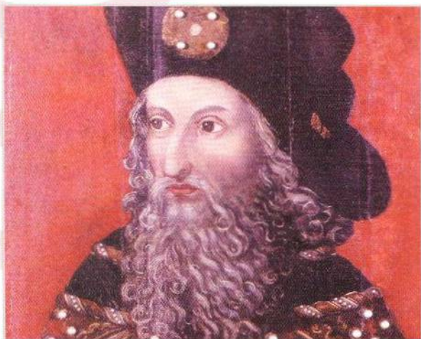
Zikmund Lucemburský, nemilovaný král