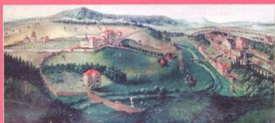
Kuks se stal rájem na zemi