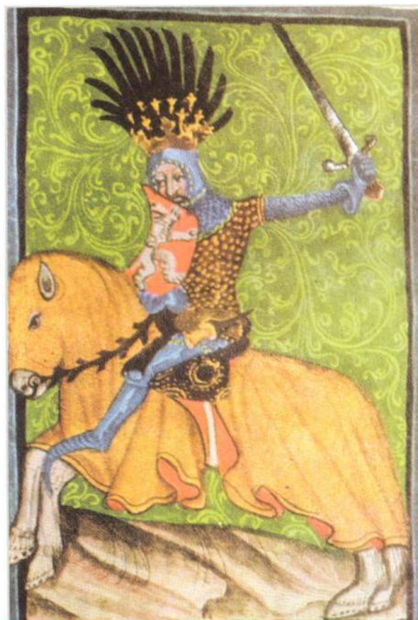
Jan Lucemburský získal roku 1311 českou korunu