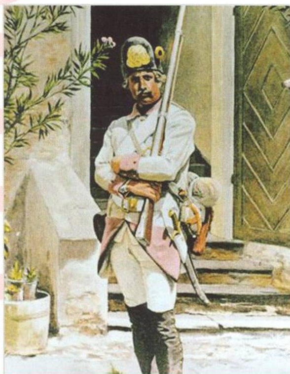
Armáda Josefa II. vzdorovala pruské invazi do Čech (str. 80)