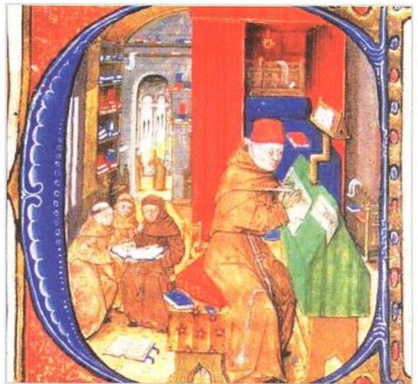
Život v tichu středověkých klášterů (str. 90)