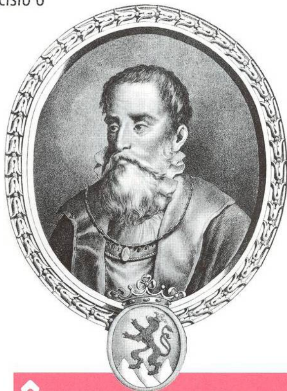
Intelektuál a velmož Karel starší ze Žerotína (str. 8)

Díky papežské bule Industriae tuae se stal Metoděj arcibiskupem