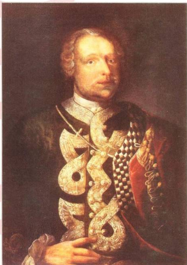
Baron Trenk byl známý svojí brutalitou a arogancí (str. 8)