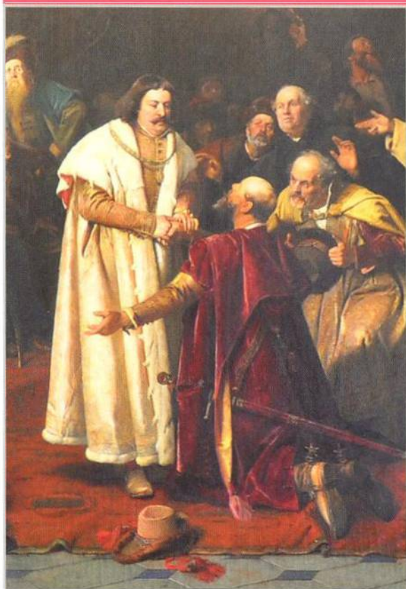
Volba Jiřího z Poděbrad českým králem (str. 66)

Tragický konec Pavlíny ze Schwarzenberku