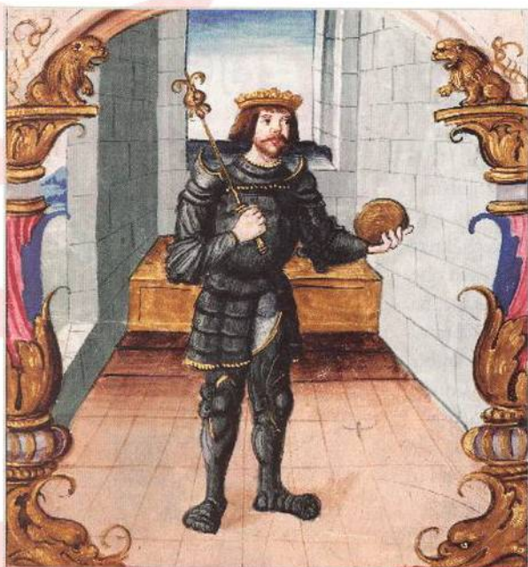
Český a uherský král Ludvík Jagellonský (str. 8)