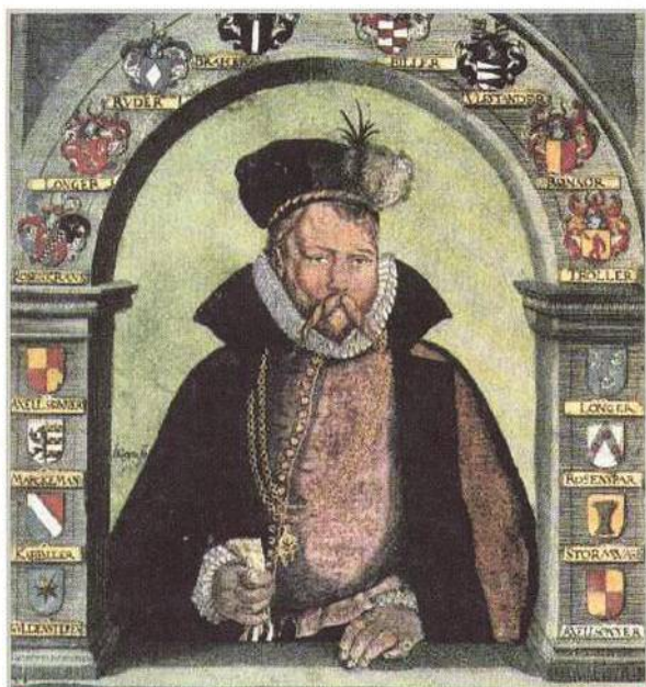
Tycho Brahe na titulní straně svého spisu Mechanica (str. 38)