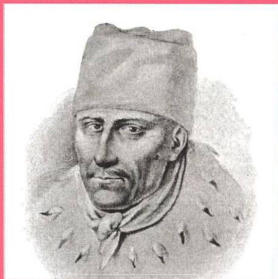
Jakub Frank si naklonil i císařovnu Marii Terezii (str. 96)