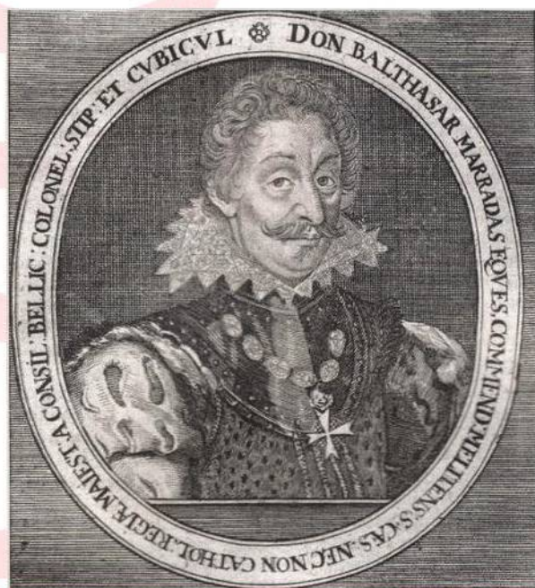
Valdštejnův podřízený a osobní nepřítel Baltazar Marradas (str. 8)