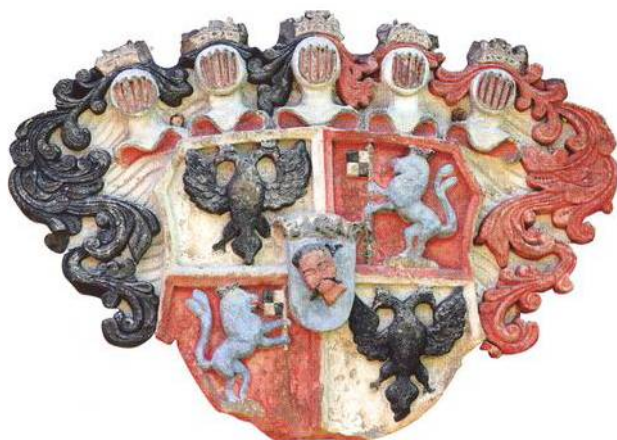
Rodový erb hrabat Šporků (str. 20)

Zámek Ploskovice se stal letním sídlem abdikovaného císaře Ferdinanda I. Dobrotivého