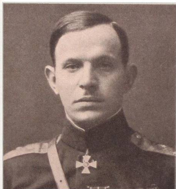
↑ Vůdce českých fašistů Radola Gajda (str. 64)