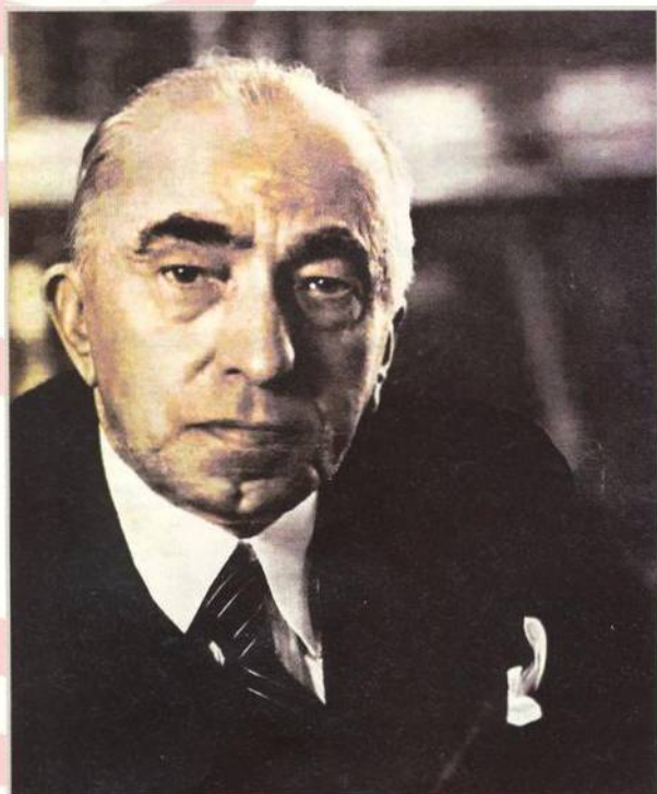
Nezáviděníhodná dilemata prezidenta Emila Háchy (str. 8)