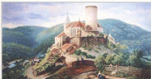
↑ Křivoklát v podobě z 19. století na obraze Josefa Mánesa (str. 62)