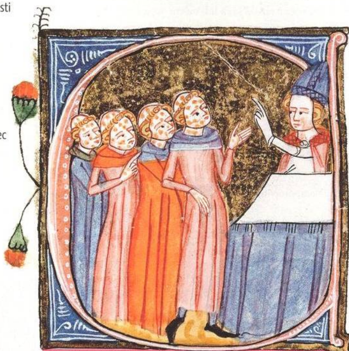
Kněz žehná postiženým morem na iluminaci z 14. století (str. 28)

Komunistický generál Bedřich Reicin nechal zavřít či popravit stovky lidí. Pak ale nemilosrdné stranické čistky dopadly i na něj