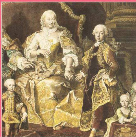
Marie Terezie se synem Josefem na detailu z rodinného portrétu z roku 1760 (str. 70)