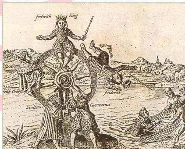
Fridrich Falcký na kole štěstěny, které jej vyneslo na vrchol a poté zase shodilo dolů (str. 8)