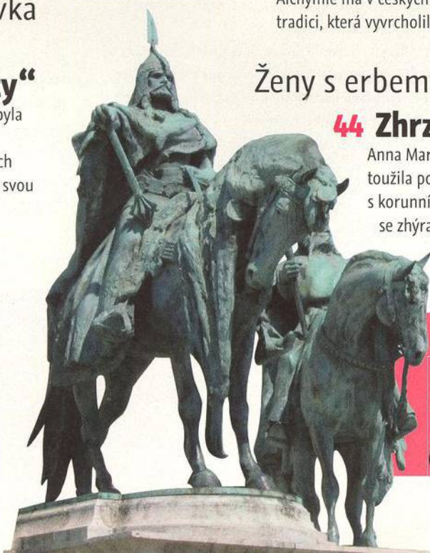
Pomník hrdinů v Budapešti připomíná maďarské kočovníky včetně zakladatele prvního vládnoucího rodu Arpáda (str. 26)

Anna Marie Františka Sasko-Lauenburská toužila po spořádaném manželství s korunním princem, ale musela se spokojit se zhýralým hýřivcem