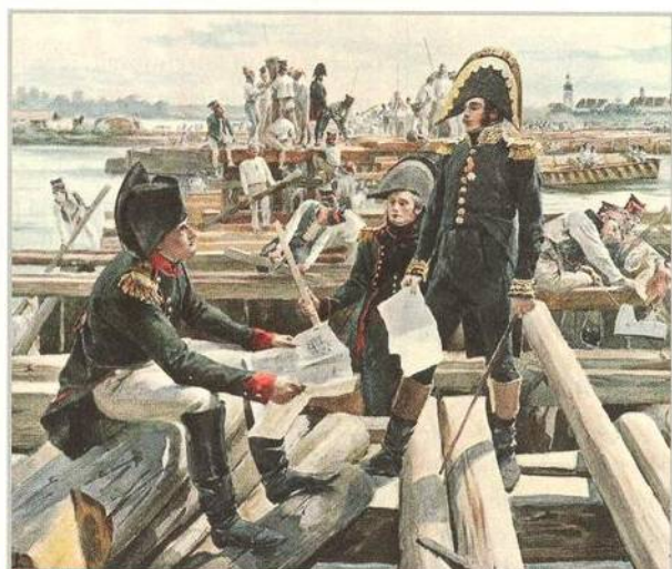
Čísař Napoleon mezi ženisty při stavbě pontonových mostů přes Dunaj (str. 34)

Mladá dáma ze Smiřic nepobrala mnoho krásy, ale zato nadměru vzdorovitosti. Její vztah s kovářem skončil doslova katastrofou