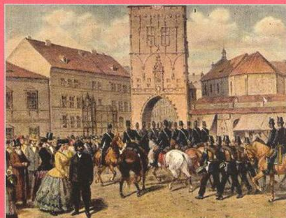
↑ Vstup pruských oddílů do Prahy (str. 70)