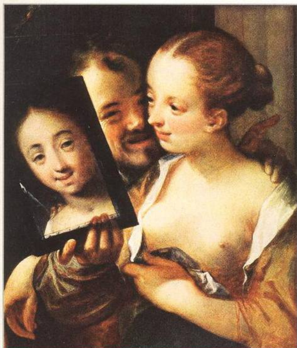
↑ Obraz Hanse von Aachen z roku 1596 nazvaný Dvojice se zrcadlem (str. 52)