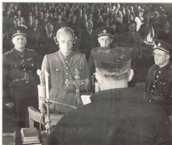
↑ Vnesení rozsudku nad Karlem Hermannem Frankem (str. 30)

Kníže Václav byl nejen světcem z legend, ale především vládcem z masa a kostí, proti němuž se postavil mladší Boleslav