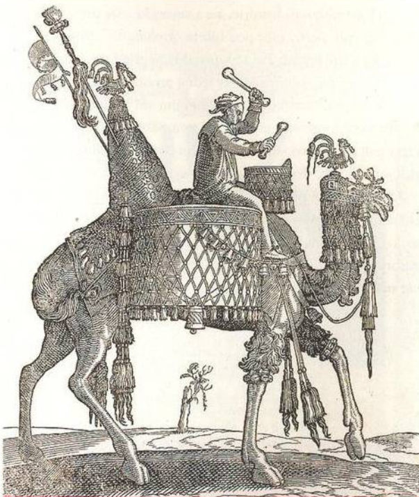
Turecký bubeník na poněkud neobratně znázorněném velbloudovi (str. 30)

Legendární krysař z německého města Hameln možná odvedl děti měšťanů až na Moravu nedaleko Brna