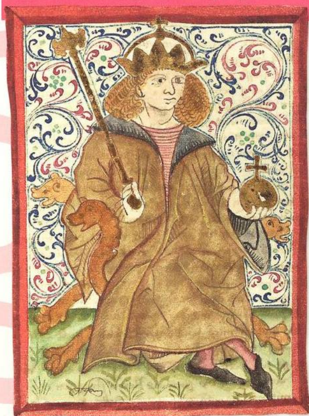
Ladislav Pohrobek ve středověké kronice (str. 8)