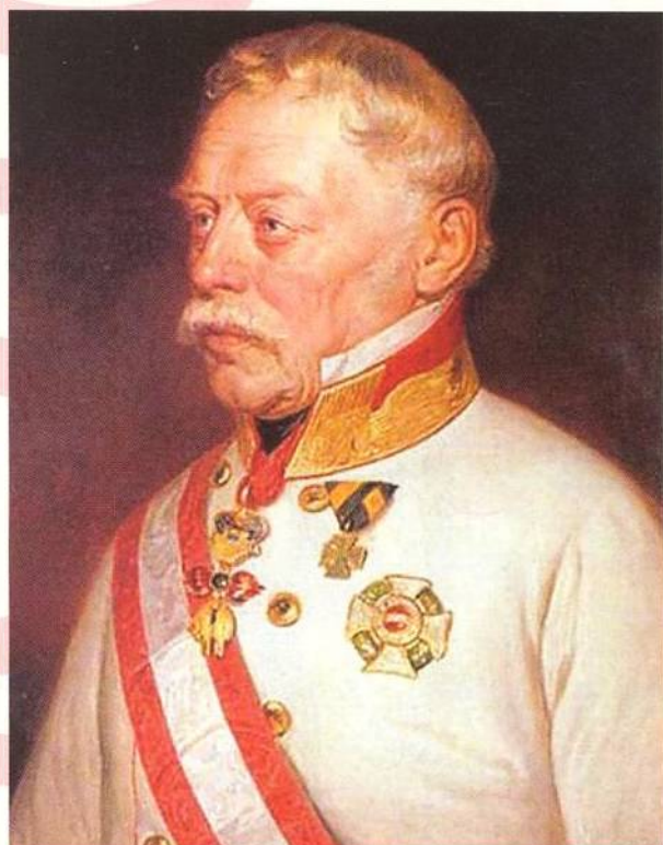
Nejznámější portrét maršála Radeckého od Georga Deckera (str. 8)