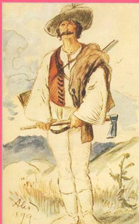
Zbojník Juráš, který zabil Ondráše, na ilustraci Mikoláše Alše (str. 70)