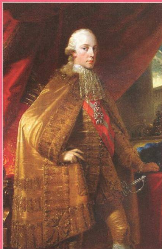
↑ Císař František II. v době svého nástupu na trůn roku 1792 (str. 70)

Setkání Petrarky s Laurou na obraze Josefa Mánesa (str. 32)