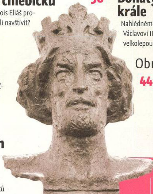
Busta Václava II. v Kutné Hoře (str. 38)

Pohled na lidovou nenávisť k Židu Leopoldu Hilsnerovi, údajnému rituálnímu vrahovi, i posměšky vůči profesorovi Masarykovi, jenž se ho zastal