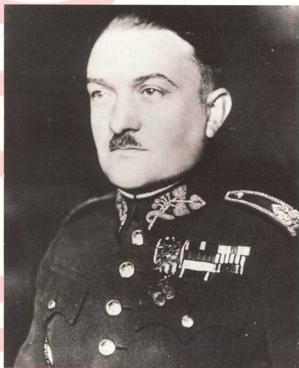
Československý generál a popravený protektorátní premiér Alois Eliáš (str. 12)