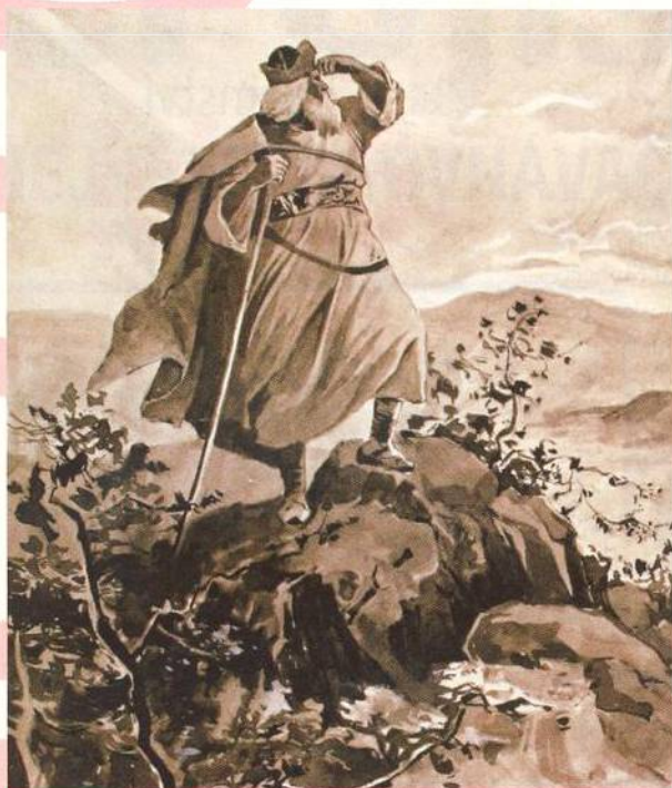
Praotec Čech na hoře Říp hledí do kraje, budoucí země české. Ilustrace od Věnceslava Černého (str. 16)