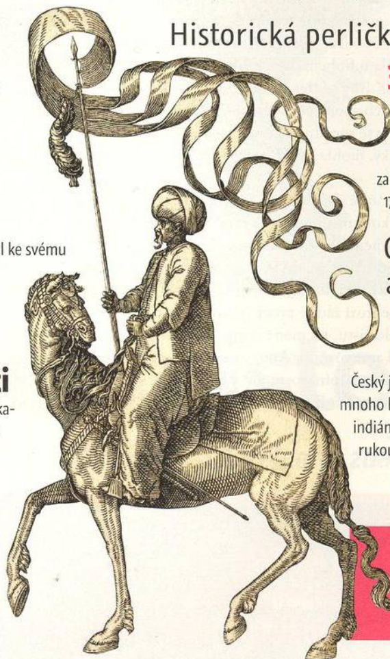
Turecký jezdec v 16. století na rytině Melchiora Lorcka (str. 40)