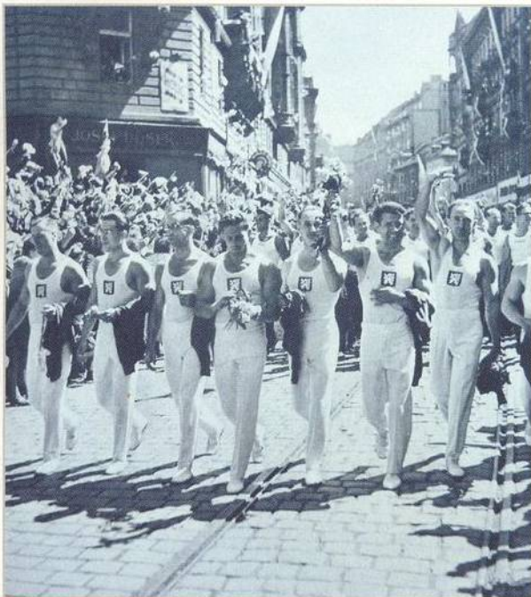
Atletičtí v sokolském průvodu Prahou v červenci 1938 (str. 60)