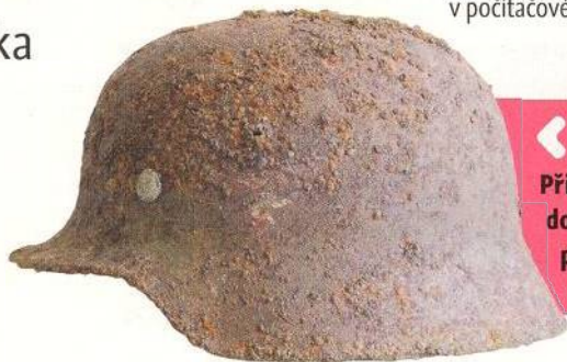
◀ Přilba vykopaná ve Vyškově patřila do výstroje Luftwaffe. Je na ní dosud patrný znak letící orlice s hákovým křížem (str. 58)

Rozhovor o projektu Kingdom Come: Deliverance, který v počítačové hře ztvárnil život v roce 1403