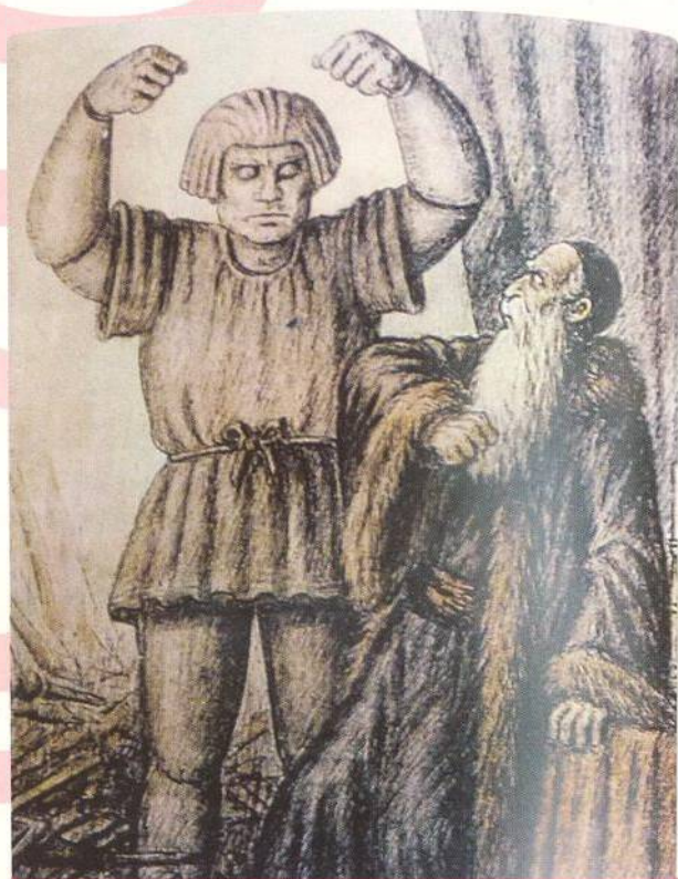
Rabi Löw a golem „egyptského střihu“ na kolorované kresbě anonymního autora z roku 1935 (str. 36)