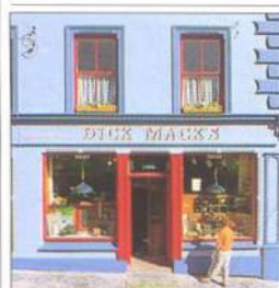
Průčelí hospody v Dingle (viz str. 157)