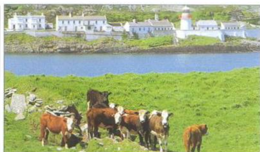
Maják na Spanish Pointu nedaleko mysu Mizen Head (viz str. 167)