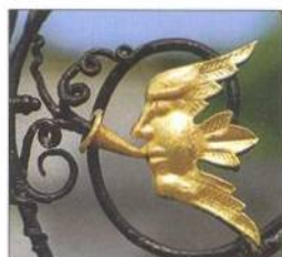
Detail brány Chorus Gate v Powerscourtu (viz str. 134–35)