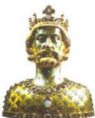
Busta Karla I. Velikého