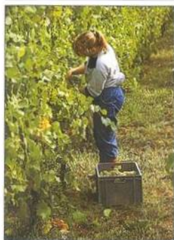
Vinobraní v Alsasku