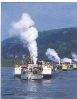
Přehlídka parníků na Labi u příležitosti městské slavnosti (viz str. 46)