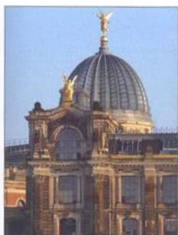
Kunstkademie na Brühlsche Terrasse (viz str. 94)