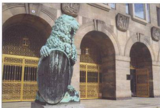
Radnice se Zlatou bránou a Lvem (viz str. 106)