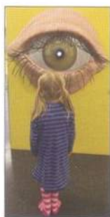
Dětské muzeum v Deutsches Hygiene-Museum (viz str. 131)