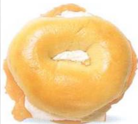
Bagel z newyorského lahůdkářství