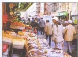
Chinatown, Lower East Side