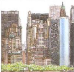
Silueta jižního Manhattanu