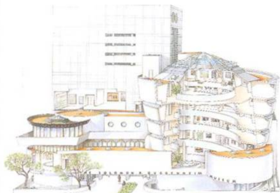
Solomon R. Guggenheim Museum, Upper East Side