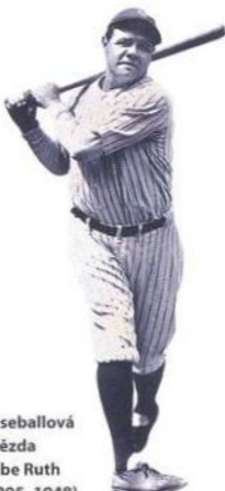
Baseballová hvězda Babe Ruth (1895–1948)