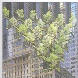
Trump Tower, Upper Midtown