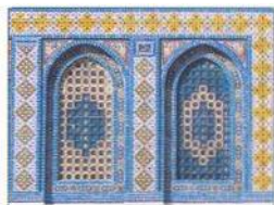
Detail okna Skalního chrámu