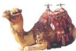
Velbloud beduinů, Západní Jordánsko