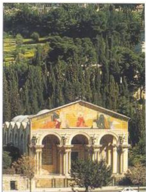
Olivová hora v Jeruzalémě