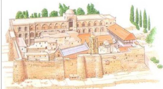
Odlehlý klášter sv. Kateřiny na Sinajském poloostrově