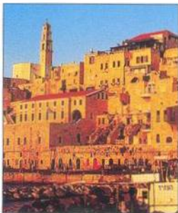
Půvabné nábřeží ve staré Jaffě