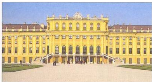
Průčelí zámku Schönbrunn (viz str. 172–75)