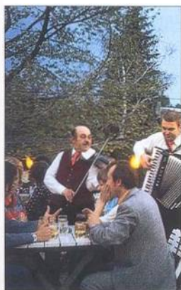
Restaurace v Grinzingu (viz str. 186–87)