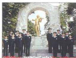
Vídeňský chlapecký sbor (viz str. 39)