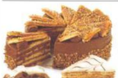
Dobostorte (viz str. 206)